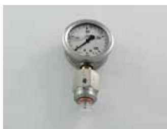
Nr katalogowy 20449