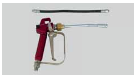
Nr katalogowy 20016